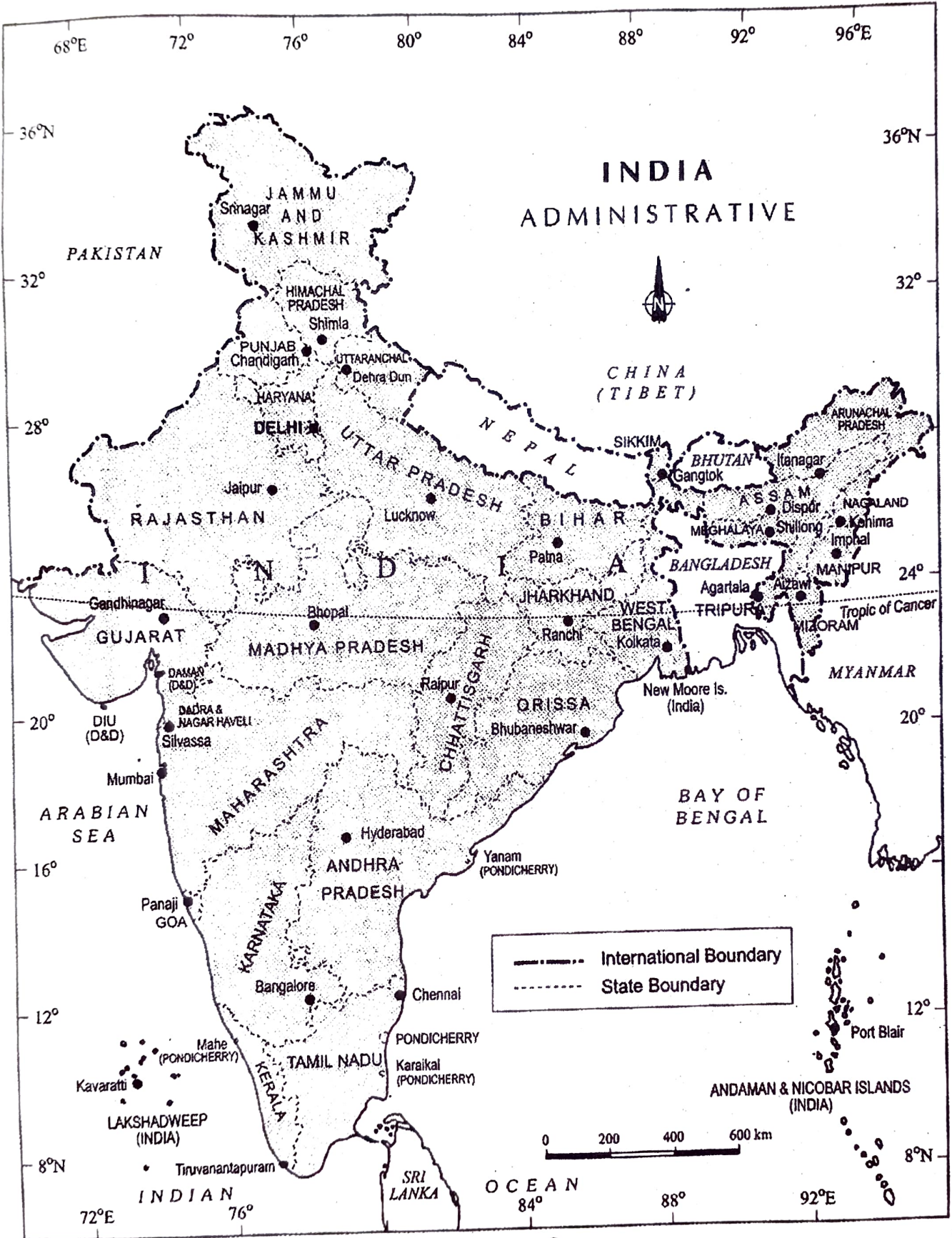
চিত্ৰ : ১.১, ভাৰতবৰ্ষ : প্ৰশাসনিক ভাগবোৰ